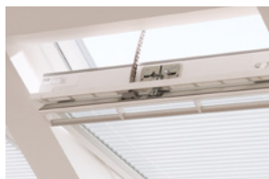
VELUX INTEGRA® Fenster mit integriertem Motor

Dabei kann in den meisten Fällen zwischen der kabelgebundenen elektrischen oder der solarbetriebenen Variante gewählt werden. Auch das Nachrüsten von bestehenden VELUX Produkten ist in der Regel unkompliziert möglich.