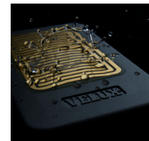
Dank integriertem Regensensor schliesst das Fenster automatisch beim ersten Regentropfen.