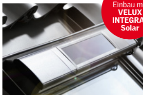
VELUX INTEGRA® Solar bietet einfachen und kabellosen Einbau ohne externe Stromzufuhr.

Kabelloser Einbau mit VELUX INTEGRA® Solar