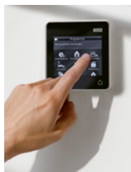
VELUX INTEGRA® Smartpad: Intuitive Bedienung mit vielen Möglichkeiten

Das VELUX INTEGRA® Smartpad bietet einen einfachen, intuitiven Weg, alle elektrischen VELUX Produkte in Ihrem Haus zentral zu steuern. Vorinstallierte Programme helfen Energie zu sparen und ein besseres Raumklima zu schaffen und können zusätzlich individuell programmiert werden. Lassen Sie sich beispielsweise mit dem «Guten Morgen»-Programm wecken oder sorgen Sie mit dem Programm «Raumklima» für regelmässiges Lüften. Und sollte es mal regnen, schliesst das Fenster automatisch dank Regensensor.